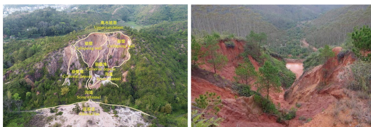
注：左图拍摄于广东梅州市，右图拍摄于广西梧州市。Note: The left photo was taken in Meizhou City, Guangdong, and the right picture was taken in Wuzhou City, Guangxi Province.

崩岗侵蚀历史久远，迫于农业生产，群众自发组织治理崩岗。继 1960 年曾昭璇 [2] 提出“崩岗”、姚庆元和钟五常 [11] 1966 年发表关于崩岗治理的学术论文后，崩岗研究开始得到相关领域学者的关注。Xu [6] 探讨了崩岗发育的影响因素，首次将崩岗研究成果推向国际。现今大部分报道聚焦于崩岗分布特征、侵蚀机理、崩积体二次侵蚀和治理技术等方面